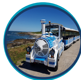
PETIT TRAIN 55 personnes maximum (animal non admis) (pas de visite en Juillet/Août)