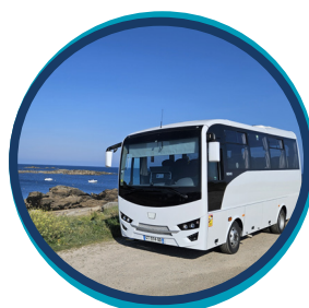
PETIT CAR CLIMATISÉ 2 cars de 29 personnes (animal non admis)

Visite du musée de la pêche et du sauvetage en mer : 5.50 €